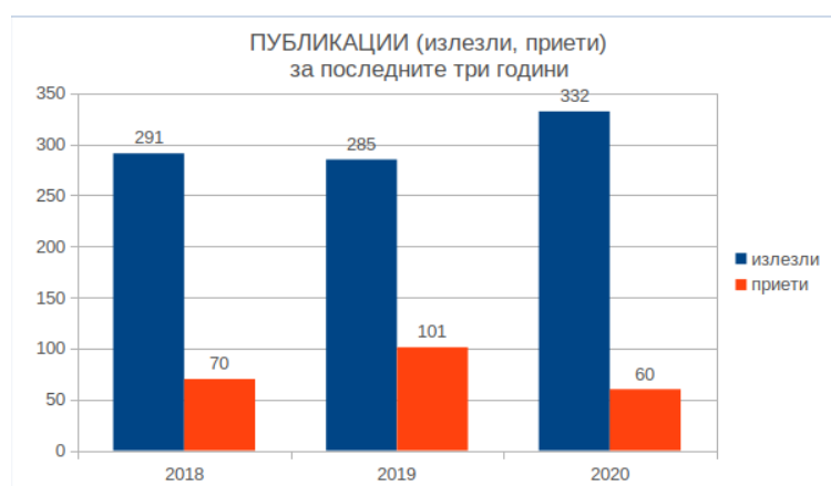
Фиг. 1а: Общ брой научни публикации на ИИКТ по години: 2018, 2019, 2020 г.

Във връзка с изпълнение на Дейност 11.1. (Разясняване на ролята на двата вида научни публикации при отчитане на дейността на института, определяне на бюджетната субсидия от БАН и класирането на ИИКТ от МОН) се наложи практика за въвеждащи лекции пред докторантите в началото на учебната година. Резултатът е налице - годишните отчети на института показват (Фиг. 1а,б), че през 2019 г. и 2020 г. статиите на учени от ИИКТ, индексирани в системите Web of Science и Scopus, имат ръст от около 20% в сравнение с 2018 г. Намалява относителният дял на неиндексираниите статии. По отношение на подобряване на информираността е необходимо да се изработят видео материали с разяснения, които да бъдат поставени на сайта на института, и новопостъпващите млади учени и докторанти да бъдат насочвани към тях за по-лесно получаване на постоянно достъпна информация.